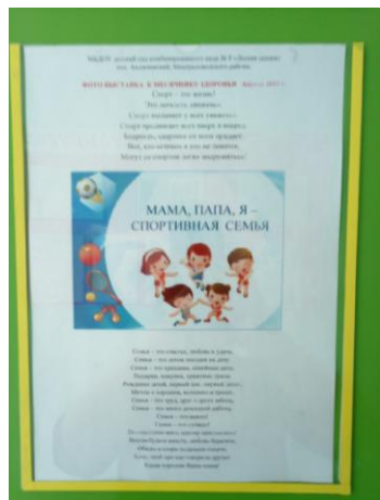
ФОТО ВЫСТАВКА К МЕСЯЧНИКУ ЗДОРОВЬЯ Апрель 2021 г.